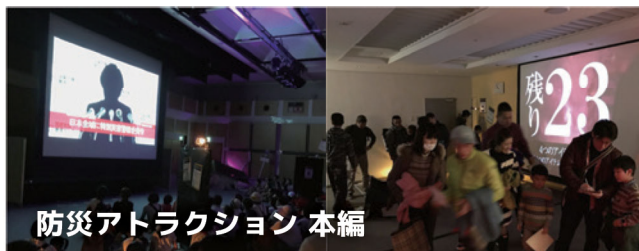
防災アトラクション 本編

防災の基本である「自助」「共助」についてのレクチャーを行い、目的意識を高めます。